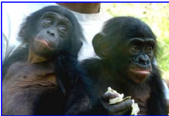
Boyoma et son nouvel ami Yolo