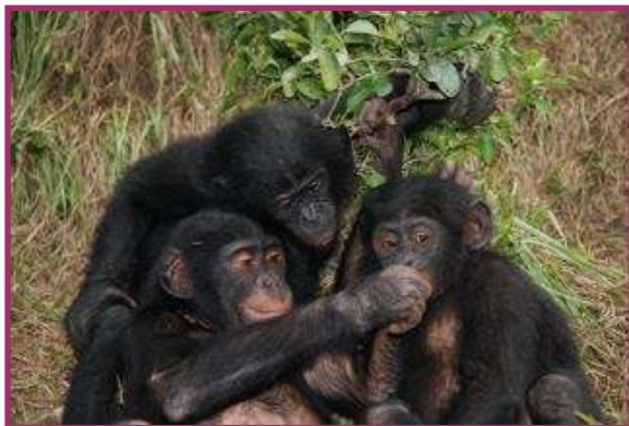
Malou et ses copains