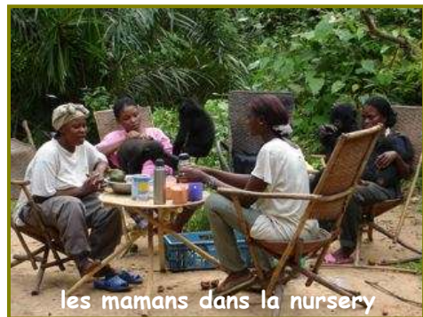
les mamans dans la nursery