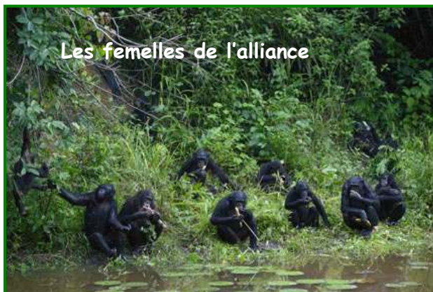
Les femelles de l'alliance

Je vais à la rencontre de Manono, le salue ; il me tend la main pour que je la prenne pour une petite pression amicale, ma façon à moi de lui dire bonjour. Opala sort de