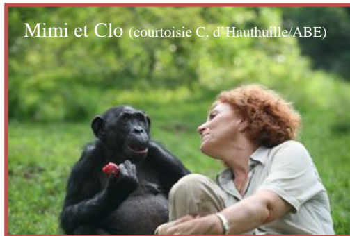
Mimia et Clo

Certes, Mimia ne serait jamais retournée à la vie sauvage ; elle avait trouvé une nouvelle vie libre dans la forêt de Lola, entourée d'amour mais aussi du respect des autres