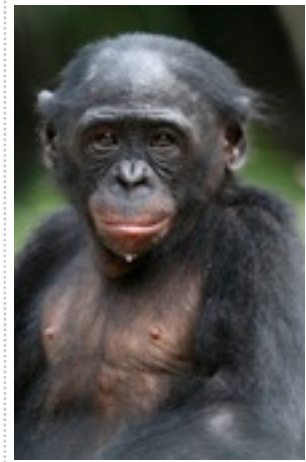
Mbano ya lola